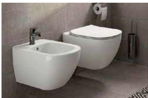
VASO SOSPESO IN CERAMICA MARCA IDEAL STANDARD MODELLO TESI o similari

L'attacco per la lavatrice costituito da presa acqua fredda e relativo scarico sarà posizionato nell'ambiente lavanderia, ove prevista, oppure in alternativa nel bagno o nel disimpegno.