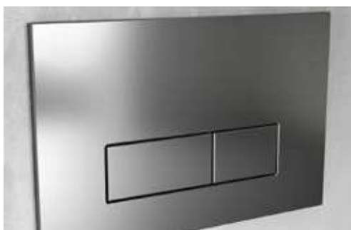
PLACCHE DI SCARICO DELLA MARCA IDEAL STANDARD MODELLO OLEAS M1 o similari COLORE BIANCO