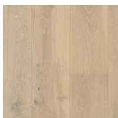
ROVERE NATURALE (PAL 5237S)