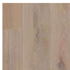
QUERCIA DI MONTAGNA OLIATA (PAL 3094S)