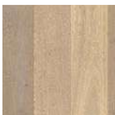
ROVERE LATTE OLIATO (PAL3885S)