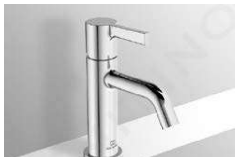
RUBINETTERIE CON FINITURA CROMO LUCIDA MARCA IDEAL STANDARD MODELLO JOY o similari PER BIDET