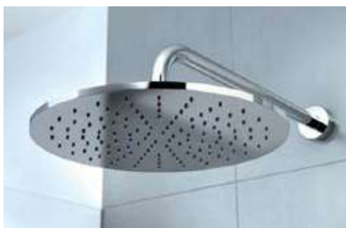
SOFFIONE DOCCIA MARCA IDEAL STANDARD MODELLO IDEALRAIN E SET MISCELATORI DOCCIA CON FINITURA CROMATA MODELLO JOY o similari