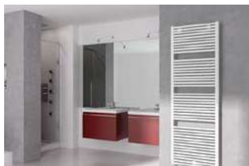
TUTTI I BAGNI SARANNO DOTATI DI SCALDASALVIETTE ELETTRICI COLORE BIANCO 115x60 cm