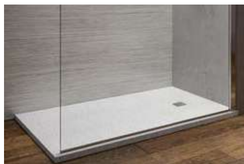
PIATTO DOCCIA IN RESINA POLIESTERE INSATURA 120x80cm o similari